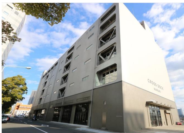
(写真左)本社社屋外観

当社は、大塚グループの企業理念「Otsuka-people creating new products for better health worldwide (世界の人々の健康に貢献する革新的な製品を創造する)」のもと、持続可能な物流網の構築を通じて、社会課題の解決と安定供給責任を果たしてまいります。